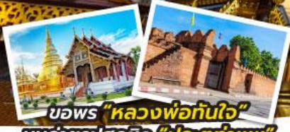
ขอพร "หลวงพ่อกันใจ" มุมถ่ายรูปลุคชีวิต "ประตูท่าแพ"