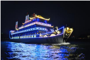
ค่ำ ที่พัก